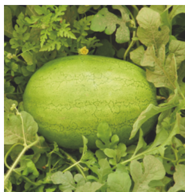
Pastèque F1 HERACLES