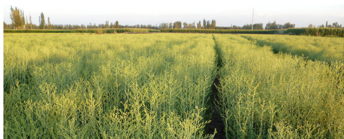
Parcelle de production de semences de laitue

Il faut en effet ouvrir plusieurs fois la pomme, pour permettre à la hampe florale de monter et de fleurir. Sans l'intervention du producteur, les laitues Icebergs ne produisent pas de semences.